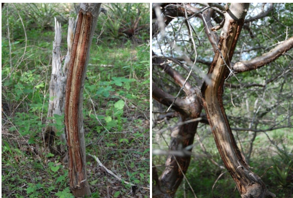
Fig 2. Registro do dano causado pela extração da casca de duas espécies com grande importância local para a aldeia indígena Fulni-ô (Pernambuco, NE Brazil). À esquerda Myracrodon urundeuva Allemão (aroeira) e Syderoxylon obtusifolium (Humb. ex Roem. & Schult.) T.D. Penn. (quixaba) à direita.

brasiliensis , Mimosa tenuiflora , Guapira noxia , Ziziphus joazeiro , Chloroleucon foliolosum , Sideroxylon obtusifolium , Acalypha multicaulis e Piptadenia stipulacea (Tabela 2).